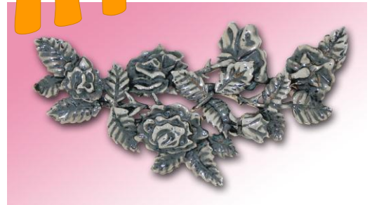
Rosenranke Brosche – 5,8x3,0 cm Sterlingsilber BR 17-201 72,00 €