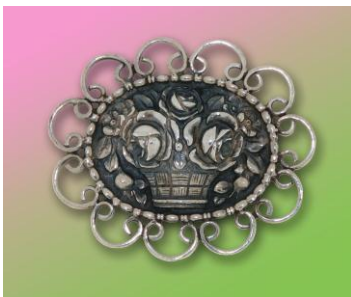
Rosenkörbchen Brosche – 3,5x3,0 cm Sterlingsilber BR 17-220 46,- €