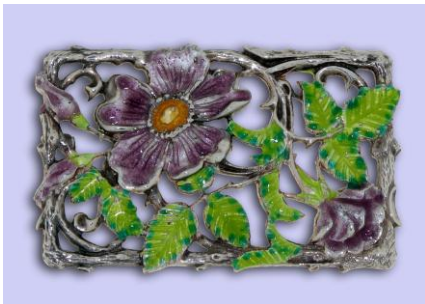
Wildrose eckig Brosche – 5,0x3,1 cm Sterlingsilber BR 17-210 66,- € Mit Email BR 27-210 109,- €