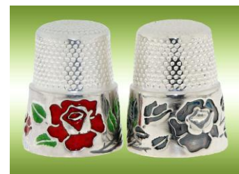
Rosenband Fingerhut - Höhe 2,4 cm Sterlingsilber Ohne Email FH 11-045 55,00 € Mit roten Email FH 21-045 85,00 €