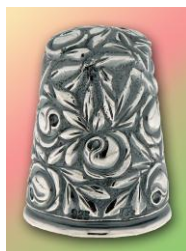
Rosenbeet Fingerhut - Höhe 2,4 cm Sterlingsilber FH 11-041 59,00 €